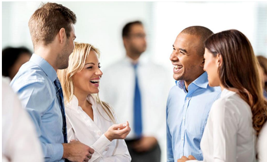
Society / By Travis Kuhn

นอกจากนี้ควรสังเกตเรื่องทีพูดเนื้อหาที่พูดว่าเรื่องใดเป็นเรื่องที่คนสนใจ โดยคนที่เริ่มเข้าสังคมทักษะแรกที่คุณสามารถทำได้คือ การฟังด้วยความตั้งใจ พยายามเก็บประสบการณ์ ก็จะช่วยให้คุณสามารถเลือกทำในสิ่งที่เหมาะสมกับตัวคุณได้ต่อไป การพัฒนาบุคลิกภาพทั้งการเสริมสร้างความมั่นใจและการพัฒนาทักษะ การเข้าสังคมเป็นสิ่งที่สามารถทำได้ทุกคน แต่ต้องอาศัยความสนใจและความตั้งใจที่จะฝึกฝนอย่างจริงจัง